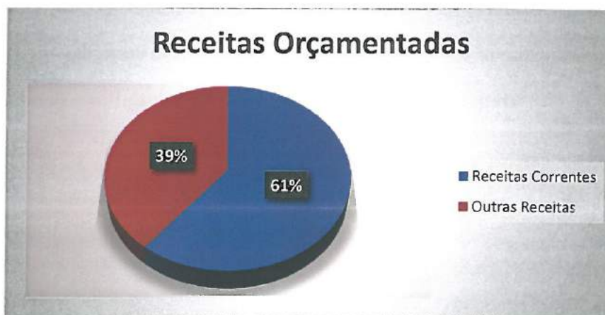
Gráfico nº 1 – Receitas Orçamentadas

Através do gráfico nº 1 conclui-se, mais uma vez, que as receitas correntes apresentam uma grande importância no orçamento das receitas da Junta, perfazendo cerca de 61% do mesmo.